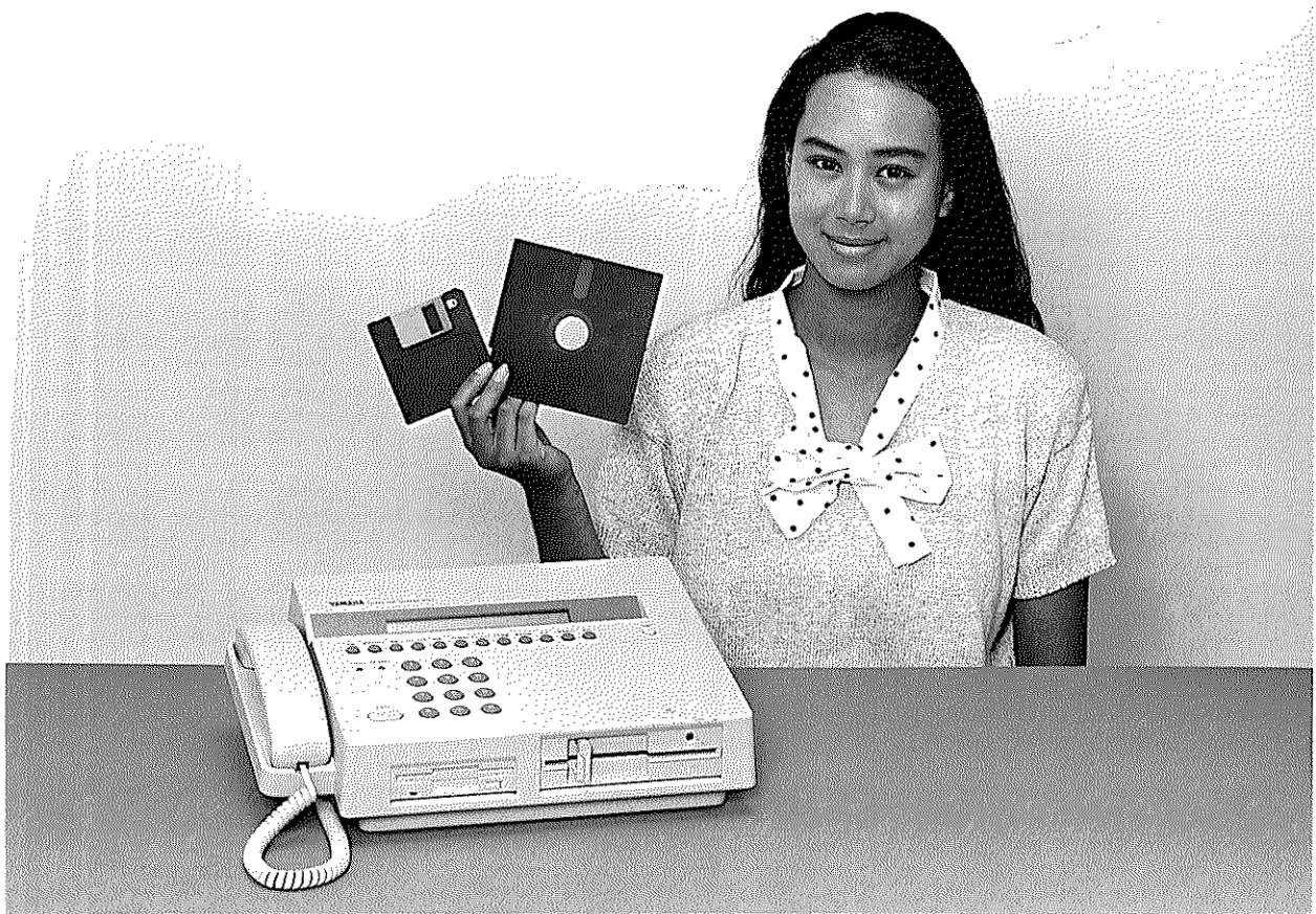
ヤマハフロッピーディスクファクシミリ『FDX1』(FDわーぶ) 価格 = 498,000円(消費税別)