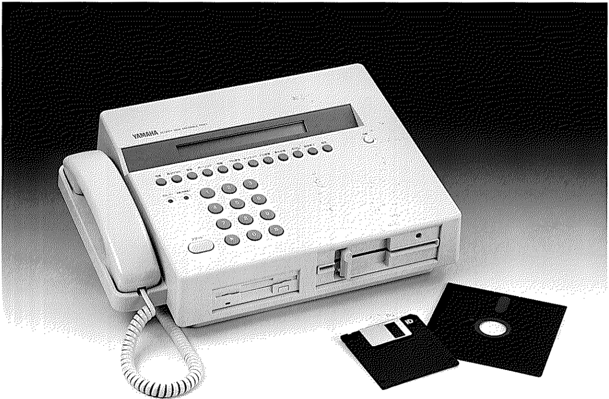
ヤマハフロッピーディスクファクシミリ『FDX1』(FDわーぶ) 価格 = 498,000円(消費税別)