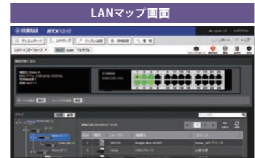
LANを見える化する機能です。