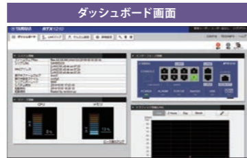
RTX1210の状態を見える化する機能です。

ヤマハルーターやファイアウォールに搭載されたスイッチ制御機能またはLANマップ機能は、ヤマハのスイッチや無線LANアクセスポイントを制御し、LANを見える化する機能です。スイッチ制御機能では、各種設定に加えて、トポロジー (LANの配線状態) の表示、スナップショット (LANの配線状態を記録して状態の変化を通知する機能)、ホスト検索などが行えます。RTX1210に搭載されるLANマップは、スイッチ制御が進化して、デザインを一新し、LANに繋がった端末の一覧・管理できるようになりました。