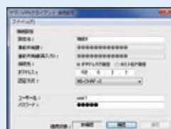
同時接続ライセンス版の「接続設定」画面

VPNクライアントソフトウェアは1つの画面から、設定/接続/切断の操作を行うことができ、簡単な操作で基本的なVPN設定が完了します。