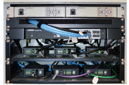
図4：ラックマウントされたSWX2322P-16MT