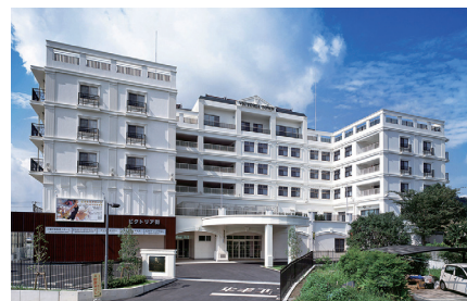
▲介護付有料老人ホーム「ピクトリア街」

2021年には、県の「介護サービス事業所ICT導入支援事業」に応募し、地域住民も利用できるスポーツジムなどを併設する大規模な外部介護付有料老人ホーム「ピクトリア街」にて、ベッドセンサーやインカムなどのICT機器と併せ、WLX212などヤマハのネットワーク機器を追加導入。新型コロナ対策として欠かせないオンライン面会やゲスト用オープンWi-Fiサービス、タブレットを用いたベッドサイドでの記録などを実現しました。さらに、ベッドセンサーによる各種データの取得&システムへの自動登録など、さらに一歩進んだICT活用により、業務効率化につながっています。WLX212については、仮想コントローラ機能や一括設定、無線の見える化など、効率運用を支援する機能などが選定のポイントとなりました。2021年4月以降、ヤマハのルーターを導入した前原総合医療病院を含めグループ全体、ノントラブルで快適なネットワーク環境をご利用いただいております。構築・運用ベンダからも「万が一がグループが発生してもネットワーク全体にまで影響しないので安心です」とその安定性について高い評価を得ています。