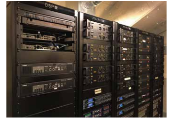
ラックマウントされた インテリジェントL2スイッチ