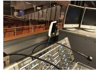
調整室内設置の 無線LANアクセスポイント

このほか、公演内容を直接デジタル録音したり、ホール間を光ケーブルでつないでデジタル音声を長距離伝送したり、これまでできなかったことを様々実現しています。