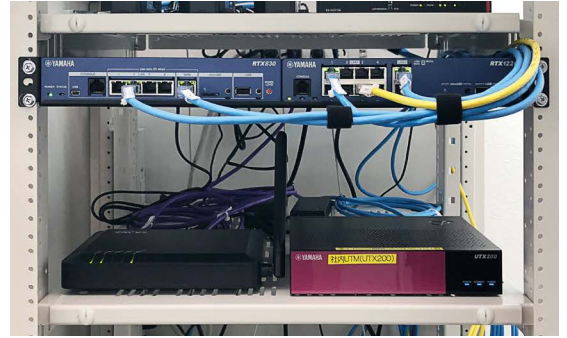
▲ ネットワークラック内部