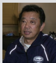
白馬観光開発株式会社 取締役

長野県内でも最大規模の大型ゲレンデである白馬・八方尾根スキー場。白馬観光開発様と八方尾根開発様の2社で24基ものリフトを管理・運営しています。両社はこのたびICカード（iCoPPa!）を使い、リフト精算システムのネットワーク化に着手。将来的にはこのシステムを活用し、Webシステムと連動させることでCRM(Customer Relationship Management)まで発展されることを構想されています。