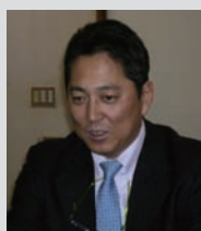
八方尾根開発株式会社 ヘルスケア事業本部 取締役 ヘルスケア本部長