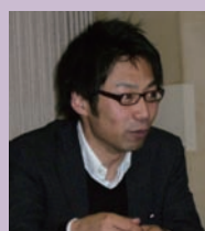
株式会社NTTドコモ 長野支店 法人営業部 法人営業担当主査